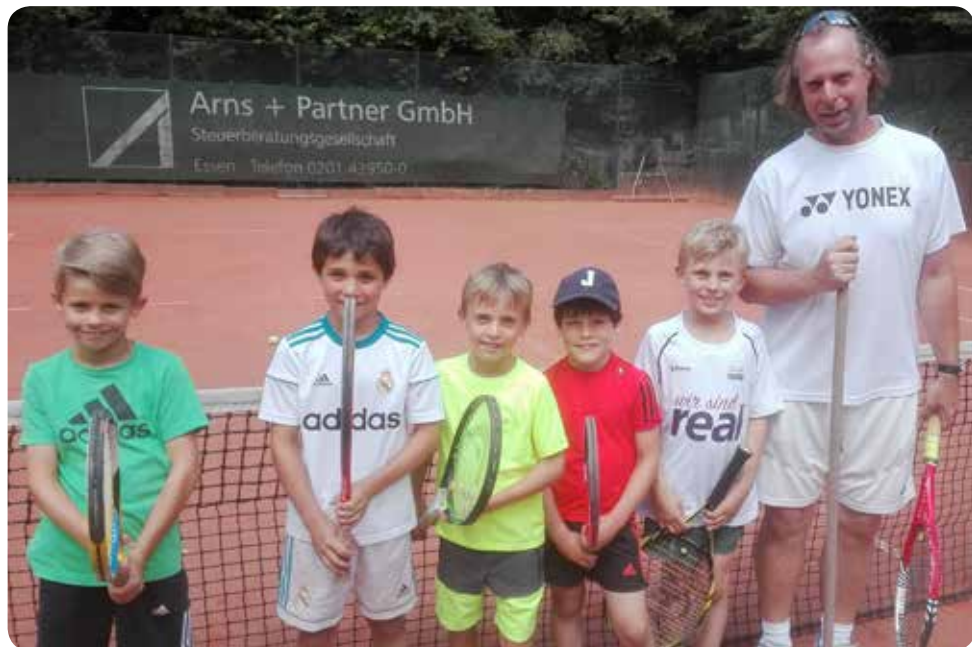
Unsere U10 beim Training.