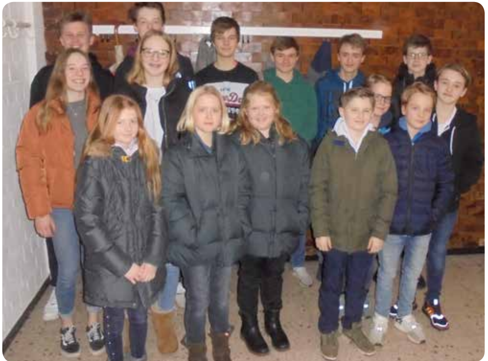
Ein Teil unserer Jugendlichen.

Nach 2 Stunden regen Meinungsaustausch endete die Versammlung gegen 20:00 Uhr