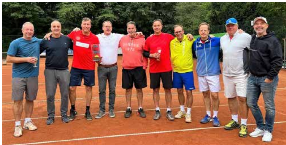
Beide Mannschaften nach dem knappen Finale auf unserer Anlage.