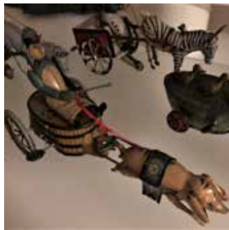
Walter Stock „...die Schweinekutsche“ von 1904