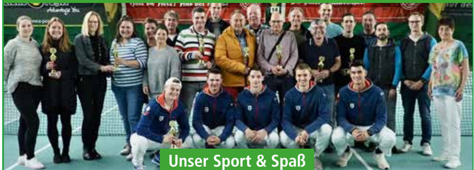
Unser Sport & Spaß