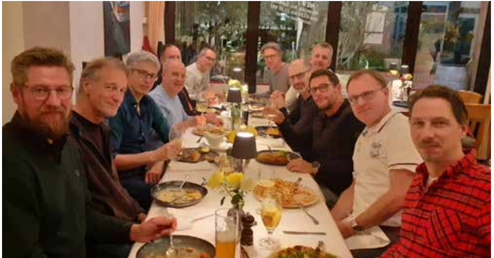
Mannschaftssessen im Aquarien.