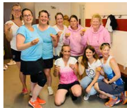
Prost auf den Klassenerhalt.