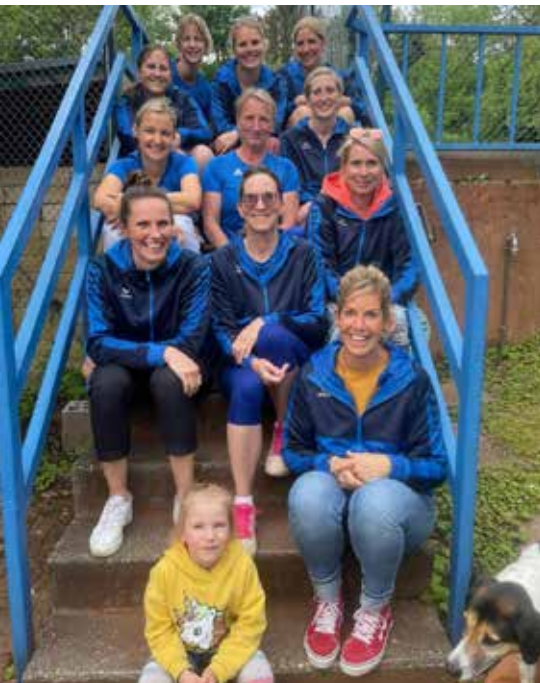
PSV Damen 30.2 Strafenkatalog 2022