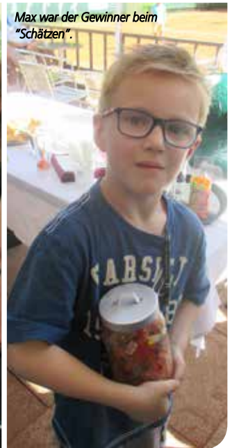
Max war der Gewinner beim "Schätzen".