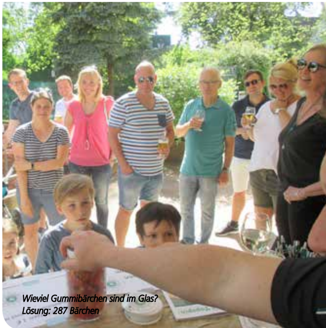
Wieviel Gummibärchen sind im Glas? Lösung: 287 Bärchen