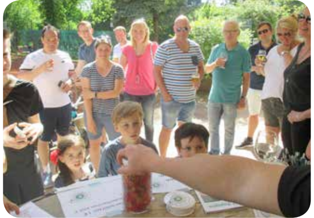
Unser Spielplatzteam beim Spendensammeln.

Mit unserem Familienbeitrag und einer Sportanlage mit er-