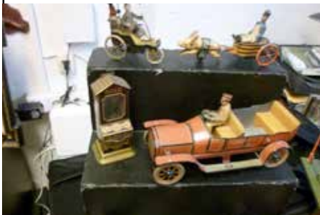
Faszinierendes antikes Blechspielzeug von Lehmann, Stock, Bing u.a.