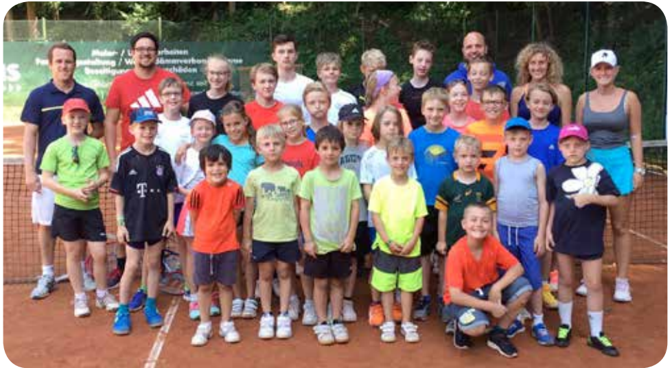
Ein Teil unserer Kinder und Jugendlichen mit den Trainern.

Die Tennisabteilung bietet abseits von Computer, Handy und Spielekonsole eine attraktive Alternative mit Sport in der Breite, mit einem Kennenlernen Gleichaltriger im eigenen Stadtteil, mit einer Weiterentwicklung eigener Fähigkeiten und Fertigkeiten sowie mit der Übernahme von ersten Verantwortlichkeiten zur Entwicklung der eigenen Persönlichkeit. Anteile dieser Vorteile treffen in gleicher Art auch auf die Eltern zu, die sich über die Kinder auf der Sportanlage ebenfalls kennenlernen und austauschen.