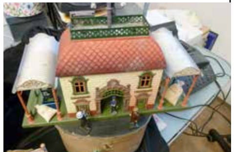
Extrem seltener Bing-Bahnhof um 1910