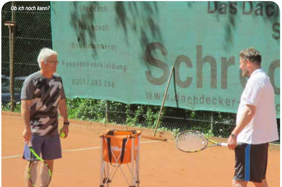
Ob ich noch kann?