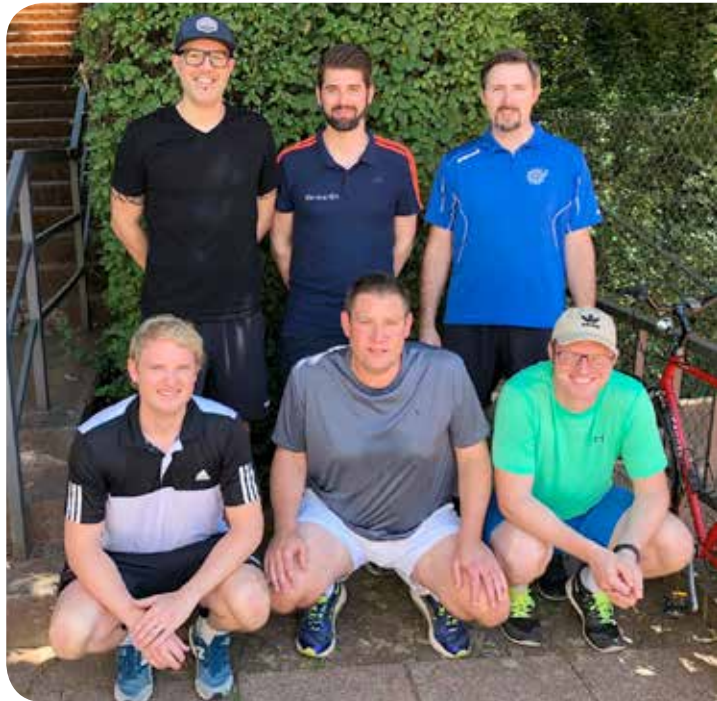
Tabelle für Herren 30, Bezirksliga, Gruppe A