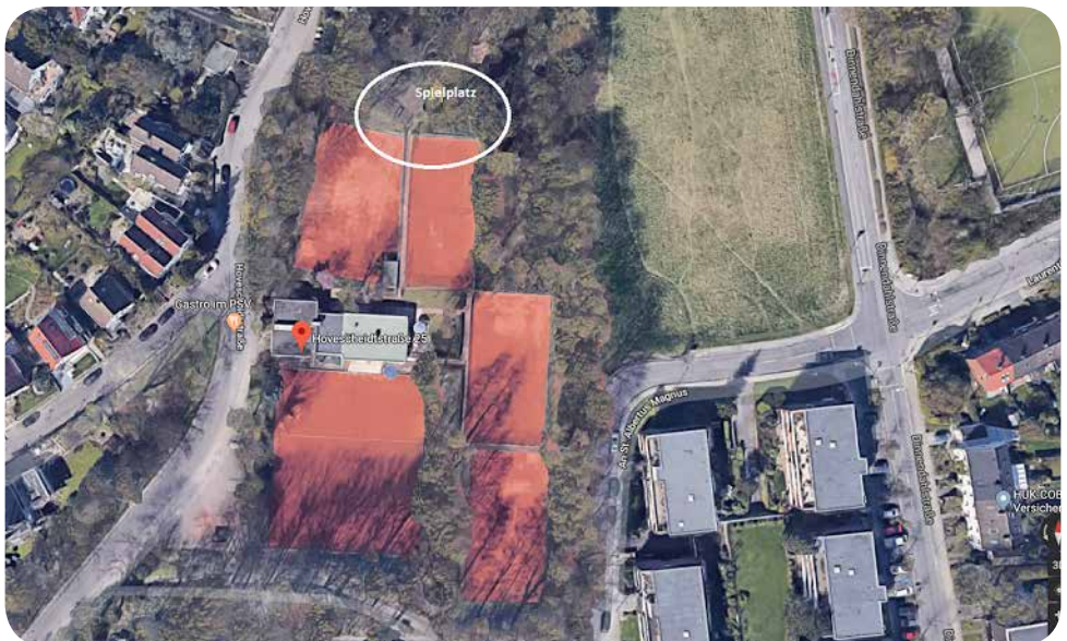
Standort geplanter Spielplatz.

Seit Jahren verfügen wir beispielsweise nicht mehr